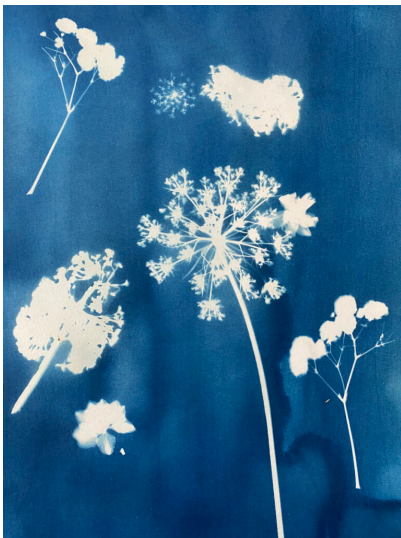
Cyanotypie, Projekt Jg. 9, gefördert vom Schulverein

das Gefühl von Skepsis und Unsicherheit ist manchmal nicht zu vermeiden. Aber der Start ins neue Jahr bietet die Gelegenheit, sich an gelungene Aktivitäten zu erinnern und mit Energie an zukünftige Aufgaben zu gehen. In diesem Sinne und mit einem kleinen künstlerischen Blumengruß zu Beginn informieren wir Sie über das zurückliegende Geschäftsjahr.