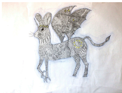
Siegerbild Europa-Wettbewerb Pia Tensfeldt